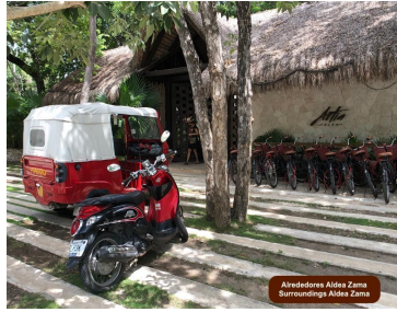
Alrededores Aldea Zama Surroundings Aldea Zama