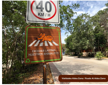
Veredas Aldea Zama / Roads At Aldea Zama