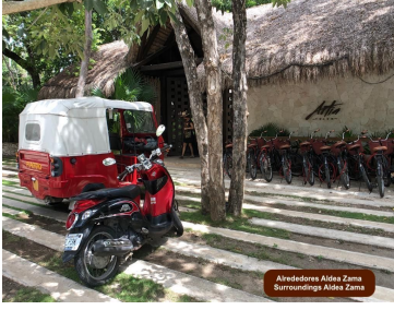
Alrededores Aldea Zama / Surroundings Aldea Zama