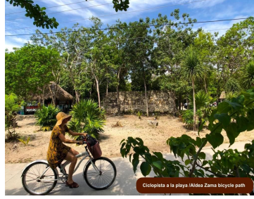
Ciclistas a la playa | Aldea Zama bicycle path