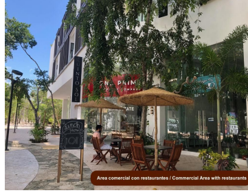
Area comercial con restaurantes / Commercial Area with restaurants