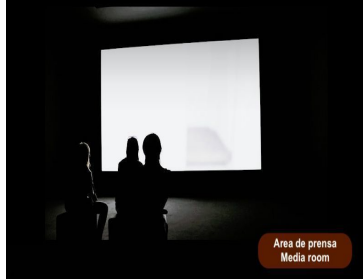
Área de prensa Media room