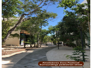
Alrededores Zona Peatonal Surroundings pedestrian street