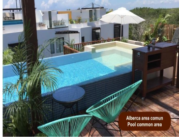
Alberca area comun Pool common area