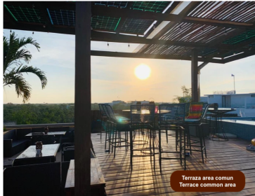
Terraza area comun Terrace common area