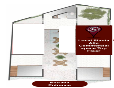
Local Planta Airs Commercial space Top Floor