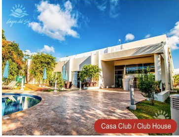
Casa Club / Club House