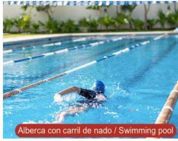
Alberca con carril de nado / Swimming pool