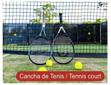
Cancha de Tenis / Tennis court