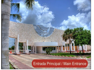
Entrada Principal / Main Entrance