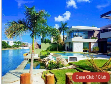
Casa Club / Club