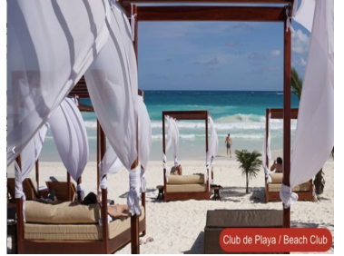
Club de Playa / Beach Club