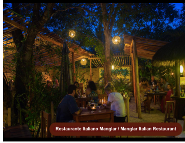
Restaurante Italiano Manglar / Manglar Italian Restaurant