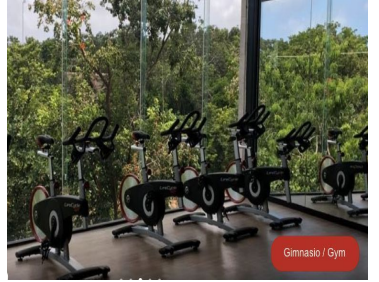
Gimnasio / Gym