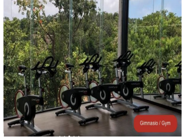
Gimnasio / Gym