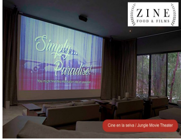
ZINE FOOD & FILMS