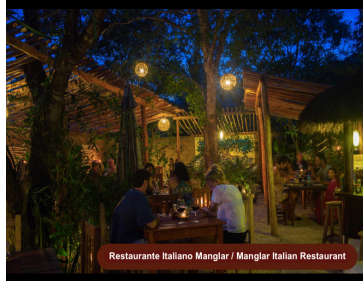
Restaurante Italiano Manglar / Manglar Italian Restaurant