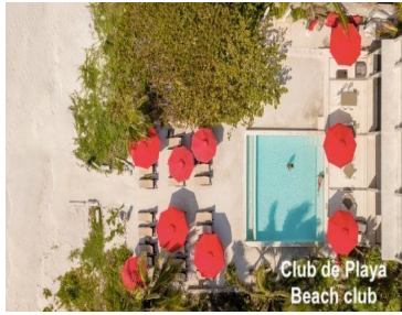
Club de Playa Beach club