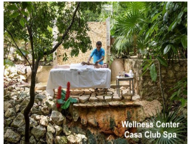
Wellness Center Casa Club Spa