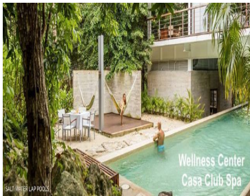
Wellness Center Casa Club Spa