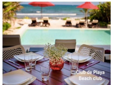
Club de Playa Beach club