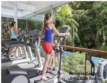
Wellness Center Casa Club Spa