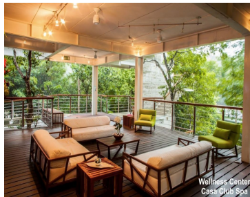
Wellness Center Casa Club Spa