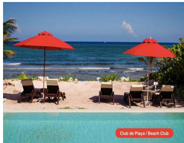
Club de Playa / Beach Club