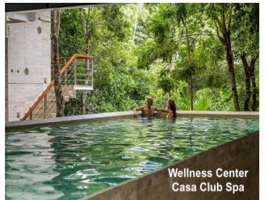
Wellness Center Casa Club Spa