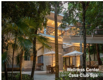
Wellness Center Casa Club Spa