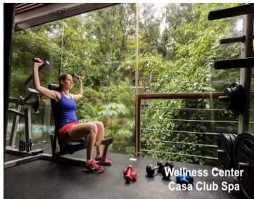
Wellness Center Casa Club Spa