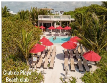
Club de Playa Beach club