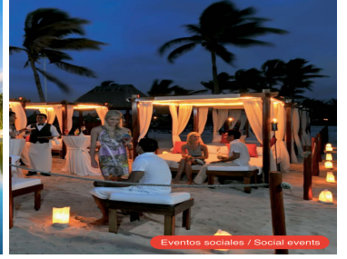
Eventos sociales / Social events