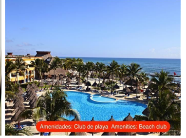
Amenidades: Club de playa Amenities: Beach club