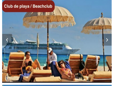
Club de playa / Beachclub