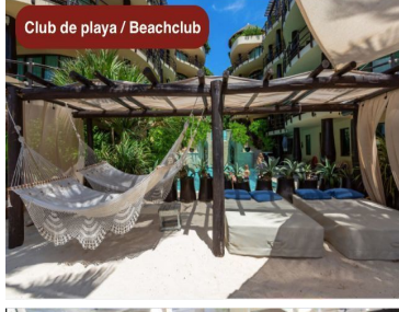
Club de playa / Beachclub