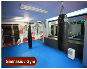
Gimnasio / Gym