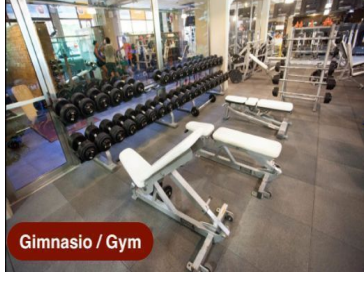
Gimnasio / Gym