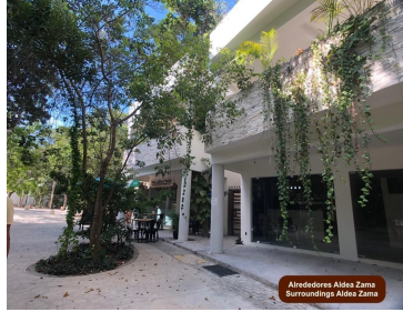
Alrededores Aldea Zama Surroundings Aldea Zama