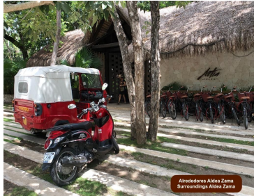
Alrededores Aldea Zama Surroundings Aldea Zama