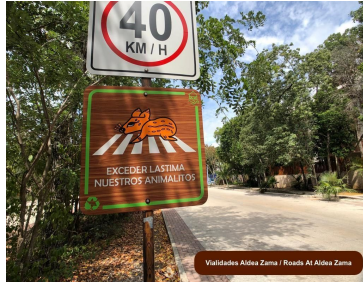
Validades Aldea Zama / Roads At Aldea Zama