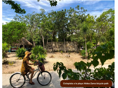
Ciclista a la playa /Aldea Zama bicycle path