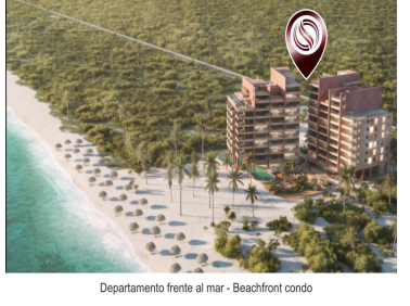
Departamento frente al mar - Beachfront condo