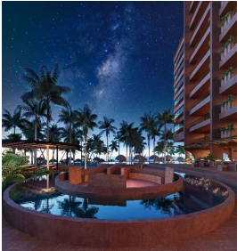
Observatorio de estrellas Star observatory