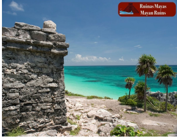
Ruinas Mayas Mayan Ruins