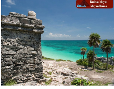
Ruinas Mayas Mayan Ruins