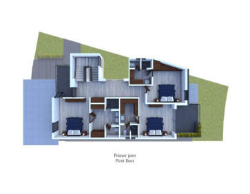
Plano principal First floor