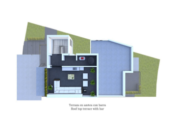
Terraza en azotea con bar Roof top terrace with bar