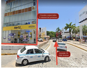
3 locales comerciales 3 commercial premises