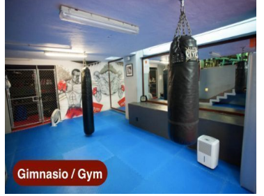
Gimnasio / Gym