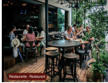
Restaurante - Restaurant