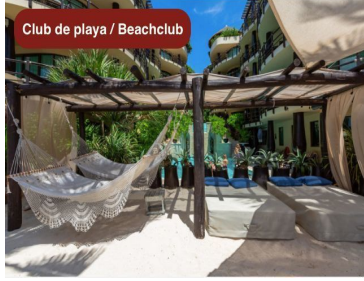
Club de playa / Beachclub