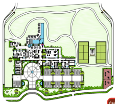
Casa Club - Club House