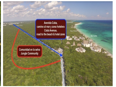
Avenida Coba, camino al mar y zona hotelera Coba Avenue, road to the beach & hotel zone Comunidad en la selva Jungle Community