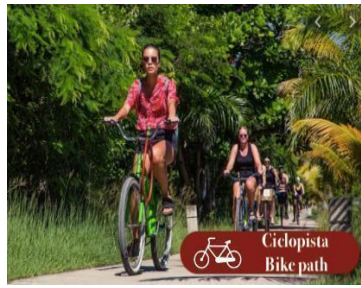
Ciclopista Bike path