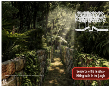
Senderos entre la selva - Hiking trails in the jungle