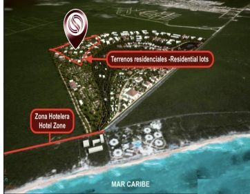
Terrenos residenciales - Residential lots