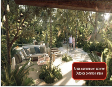
Areas comunes en exterior Outdoor common areas