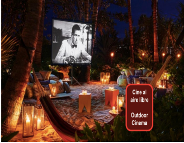
Cine al aire libre Outdoor Cinema