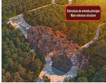
Estructura de entrada principal Main entrance structure