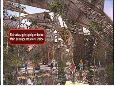
Estructura principal por dentro Main entrance structure, inside