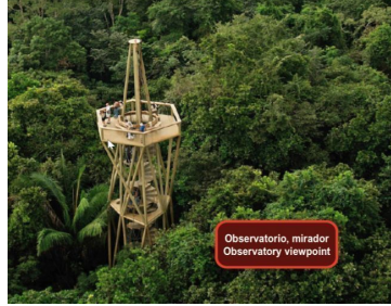
Observatorio, mirador Observatory viewpoint