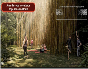
Area de yoga y senderos Yoga zone and trails