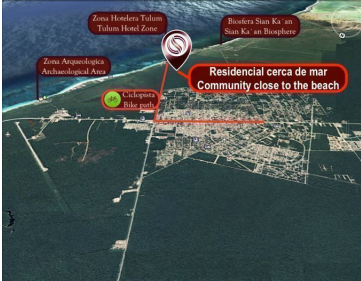
Residencial cerca de mar Community close to the beach