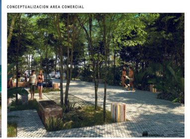
CONCEPTUALIZACION AREA COMERCIAL