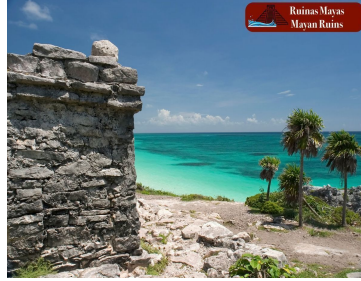
Ruinas Mayas Mayan Ruins