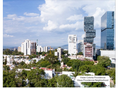
Visita Colonia Providencia Views Providencia Neighborhood