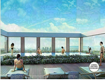
Alberca techada panorámica