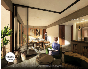
Área de descanso y lounge Indoor lounge