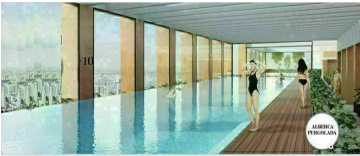
Alberca techada vista panorámica Roofted pool panoramic view