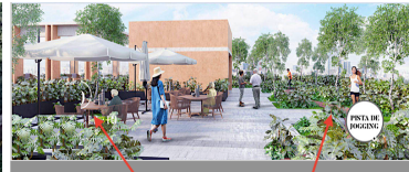
Áreas de descanso en exterior Outdoor lounge areas