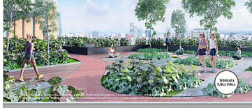
Terraza para yoga a 30 metros de altura Yoga terrace 30 meters high