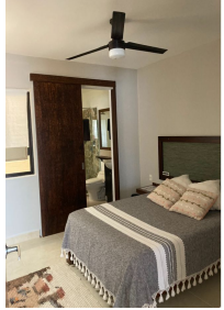
Recamara principal Main bedroom