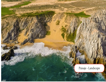
Paisaje - Landscape