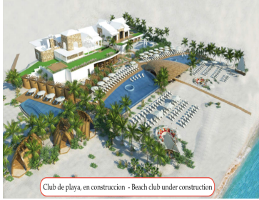
Club de playa, en construcción - Beach club under construction