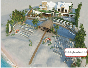
Club de playa - Beach club