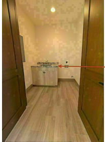
Área de lavandería de lujo dentro del departamento cubierta de piedra natural Luxury laundry room inside your condo natural stone cover