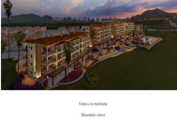
Vistas a la montaña Mountain views