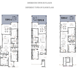
DIFERENTES TIPOS DE PLANOS DIFFERENT TYPES OF FLOOR PLANS