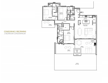
CONDOPRIO 3 RECAMARAS 3 BEDROOM CONDOMINIUM