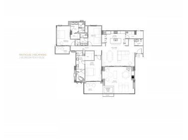
RESIDENCIAL TIERRAS RESIDENCIAL TERRACE