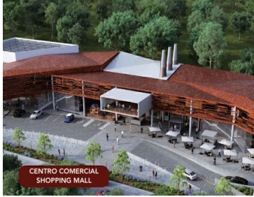
CENTRO COMERCIAL SHOPPING MALL