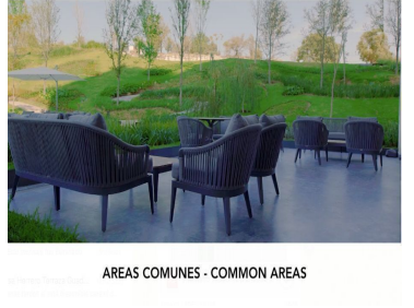
ÁREAS COMUNES - COMMON AREAS