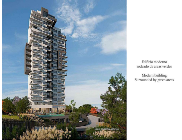
Edificio moderno rodeado de áreas verdes Modern building surrounded by green areas