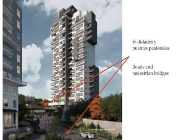
Vialidades y puentes peatonales Roads and pedestrian bridges