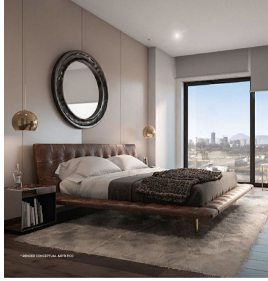
Recamaras con ventana de piso a techo Floor to ceiling windows in bedrooms