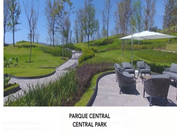
PARQUE CENTRAL CENTRAL PARK