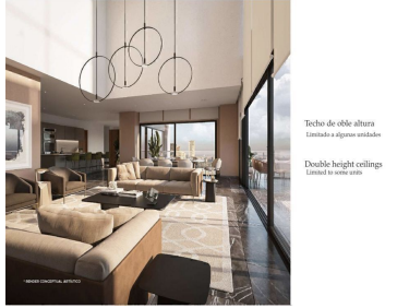
Techo de doble altura iluminado a ras del nivel Double height ceilings lit to the level