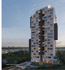
Vista posterior Rear view