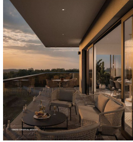
Terrazas con vista panorámica Terraces with panoramic views