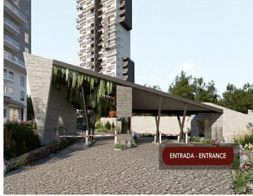
ENTRADA - ENTRANCE