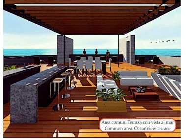
Area comun: Terraza con vista al mar Common area: Oceanview terrace