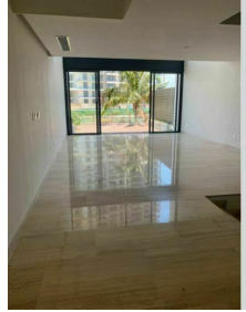
Recamara principal vista al canal Main bedroom canal view