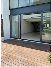
Sala doble altura ventana de pared completa Double high living room Full wall window