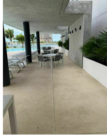
Areas comunes vista al agua Common areas water view