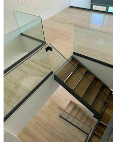
barandales de vidrio templado Tempered glass riats