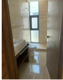
Baño cubierto en marmol Mable in bathroom walls