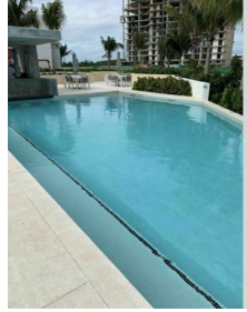
Family pool Alberca familiar