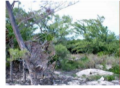
Manglar - Mangrove