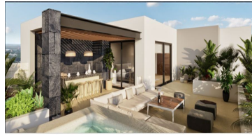
Terraza - Penthouse - Terrace