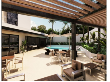
Terraza - Penthouse - Terrace