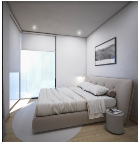
Recamara principal Main room