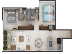
Departamento 2 recamaras con terraza 2 Bedroom condo with terrace