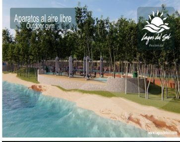
Aparatos al aire libre Outdoor gym