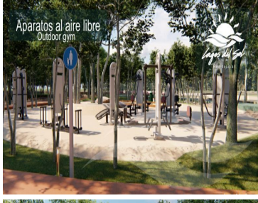
Aparatos al aire libre Outdoor gym