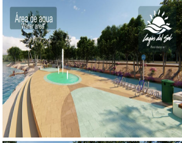
Área de agua Water area