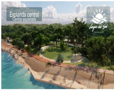
Explanada central Central esplanade