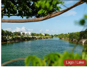
Lago / Lake