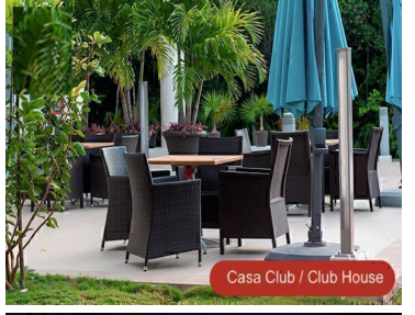
Casa Club / Club House