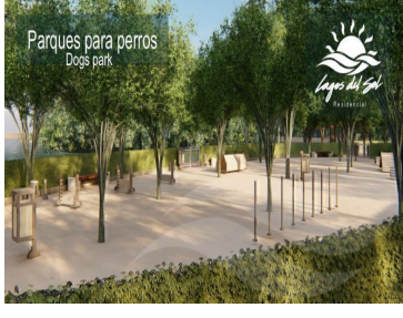
Parques para perros Dogs park