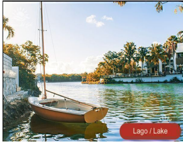
Lago / Lake