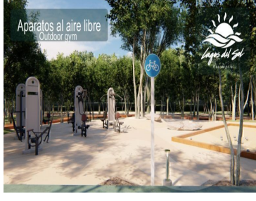
Aparatos al aire libre Outdoor gym