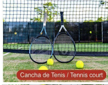
Cancha de Tenis / Tennis court