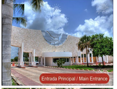
Entrada Principal / Main Entrance