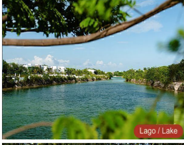
Lago / Lake