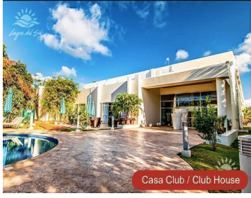
Casa Club / Club House