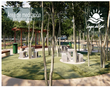
Área de meditación Meditation area