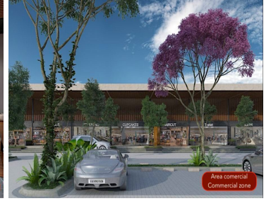
Area comercial Commercial zone