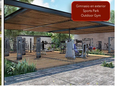
Gimnasio en exterior Sports Park Outdoor Gym