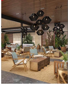
Area lounge Casa club Club house lounge area