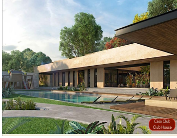
Casa Club Club House