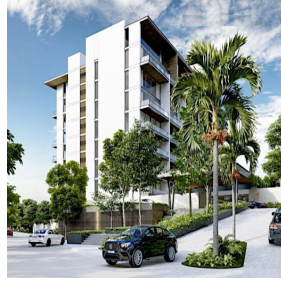
Edificio con áreas verdes Building with green areas