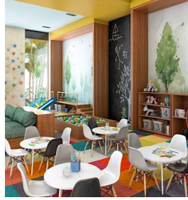
Ludoteca Indoor kids zone