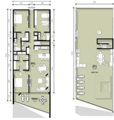
Profilouse 3 Recamaras 3.5 Baños Profilouse 3 Bedrooms 3.5 Bathrooms