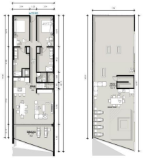
Profilouse 3 Recamaras 3.5 Baños Profilouse 3 Bedrooms 3.5 Bathrooms