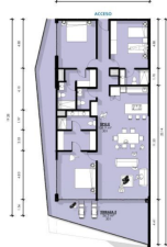
Departamento 3 Recamaras 3.5 Baños Condo 3 Bedrooms 3.5 Bathrooms