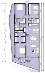
Departamento 3 Recamaras 3.5 Baños Condo 3 Bedrooms 3.5 Bathrooms