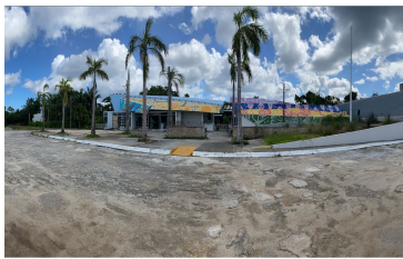
Vista frontal - front view