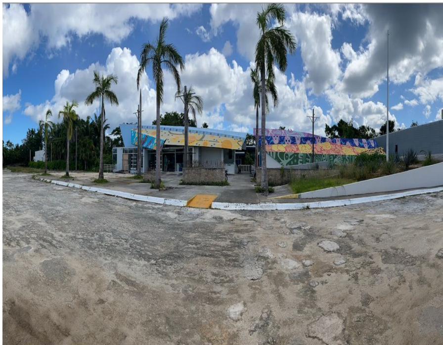
Vista frontal -Front view