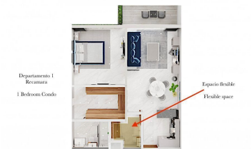
Departamento 1 Residencia 1 Bedroom Condo