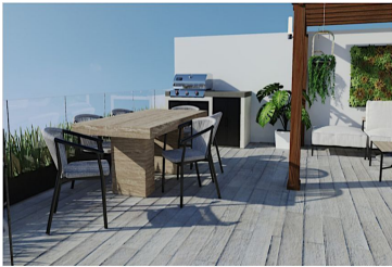
Terraza Penthouse Penthouse Terrace