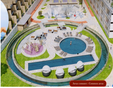
Áreas comunes - Common areas