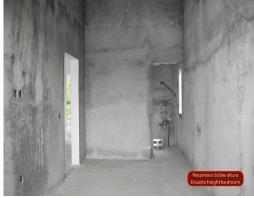
Recámara doble altura Double height bedroom