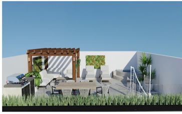
Terraza Penthouse Penthouse Terrace