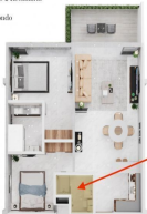
Espacio flexible Flexible space