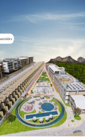
Ampliados - Amenities