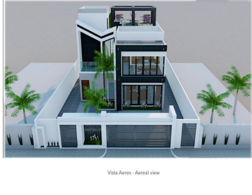
Vista Aerea - Aerial view