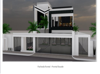
Fachada frontal - Frontal facade