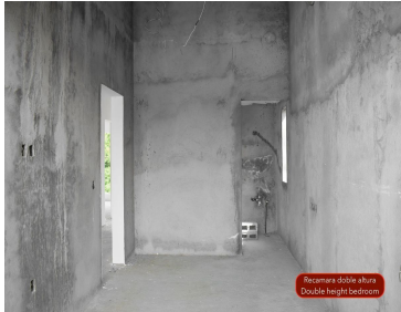
Recámara doble altura - Double height bedroom