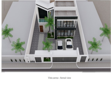
Vista aerea - Aerial view