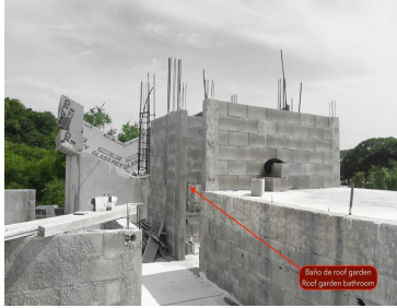
Baño de roof garden - Roof garden bathroom