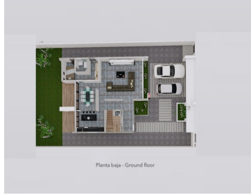
Planta baja - Ground floor