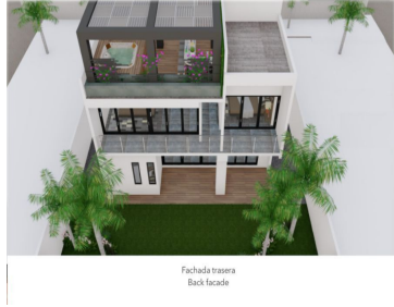
Fachada trasera - Back facade