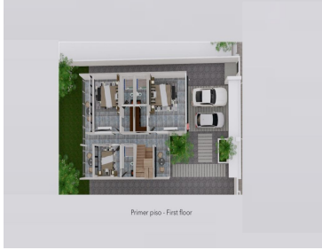
Primer piso - First floor