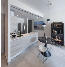
Contemporary Built-in kitchen