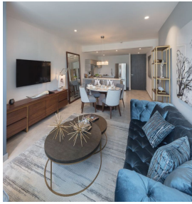
Charismatic Open design