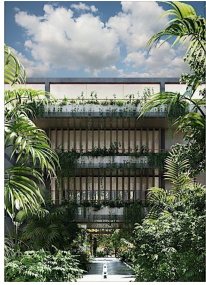
Entrada principal Main entrance