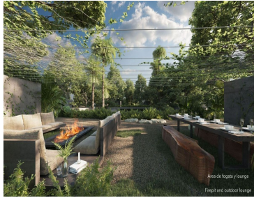
Área de fogón y terraza Firepit and outdoor terrace