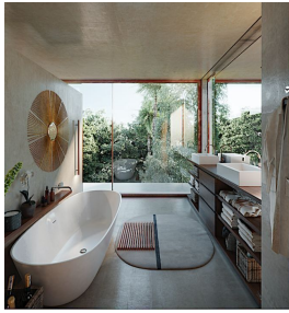
Baño principal vista verde Main bathroom green view