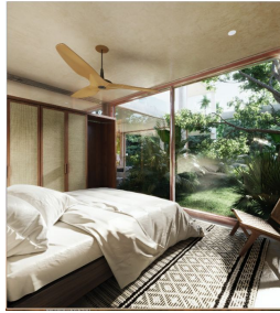
Recámara Ventada de pared completa Bedroom Full wall window