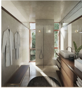
Baño luz natural Bathroom natural light