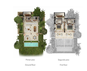
Primer piso Ground floor