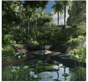
Fuente Espejos de agua Fountain Water mirrors