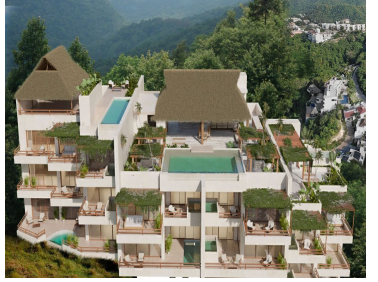
Lugares cercanos Places near by