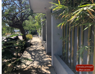
Entrada principal Main access