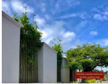
Fachada, mallas exteriores Facade, outdoor patio