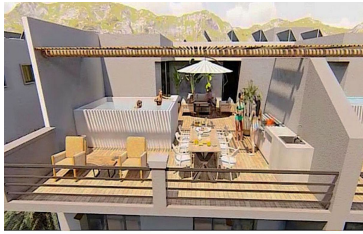
Penthouse con alberca privada Penthouse with private pool