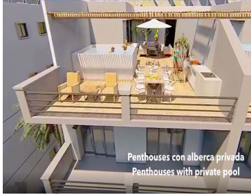
Penthouses con alberca privada Penthouses with private pool