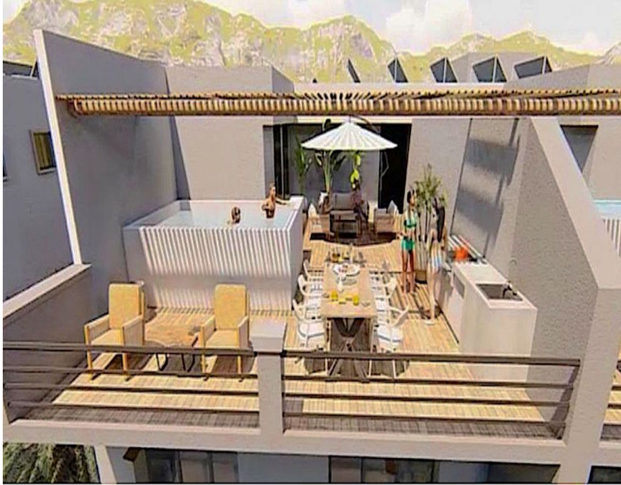
Penthouse con alberca privada Penthouse with private pool