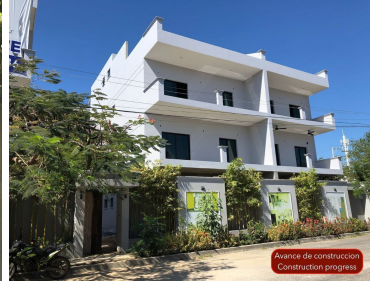
Avance de construcción Construction progress