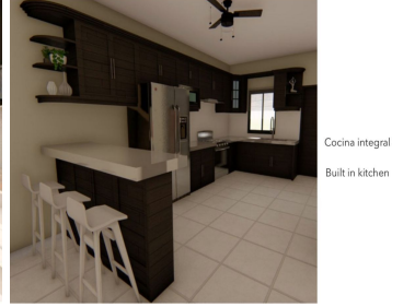
Cocina integral Built in kitchen