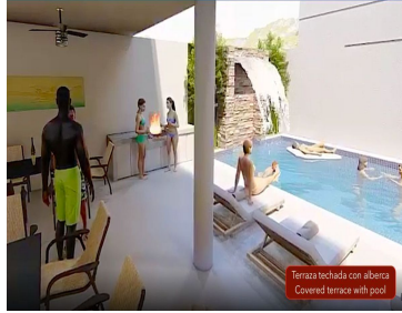
Terraza techada con alberca Covered terrace with pool