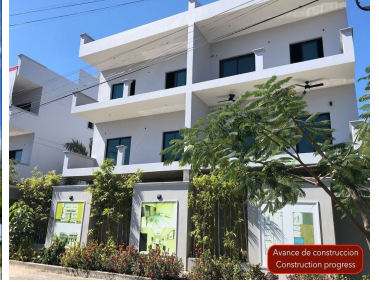
Avance de construcción Construction progress