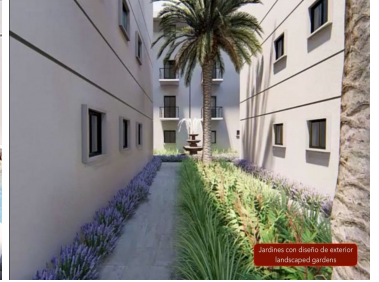
Jardines con diseño de exterior landscaped gardens