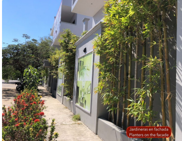
Jardines en fachada Plants on the facade