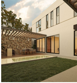
Terraza amplia que se conecta con la sala Wide terrace that connects to the living room