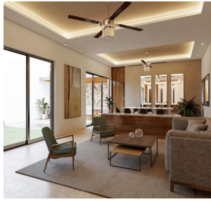
Ventanas de piso a techo Floor to ceiling windows