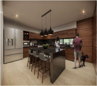
Cocina Isla Central Kitchen with island