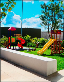
Area de juegos para niños en exterior Outdoor children's playground