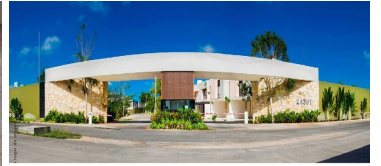
Entrada principal Acceso controlado Barda perimetral Main entrance Controlled access Perimeter fence