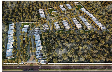
Vista Aerea del residencial Gated community aerial view