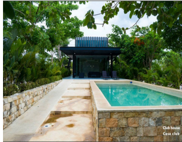
Club house Casal club