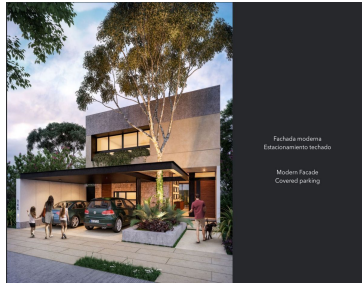
Facada moderna Estacionamiento techado Modern facade Covered parking