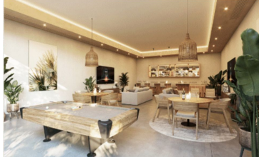
Área de usos múltiples Multiple purpose room