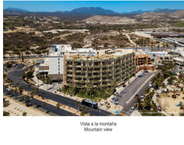
Vista a la montaña Mountain view