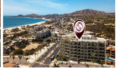
A 300 metros del mar 300 meters from the beach