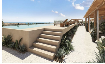
Alberca infinity con vista al mar Ocean view infinity pool