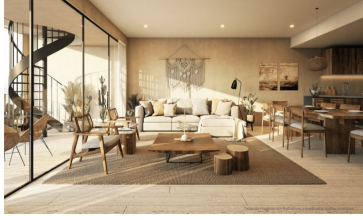
Terraza privada en planta alta en algunas unidades Roof top private terrace in some units

Todas las imágenes con fachadas y plantas pueden sufrir cambios.