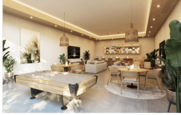
Área de usos múltiples Multiple purpose room