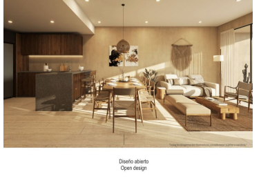
Diseño abierto Open design