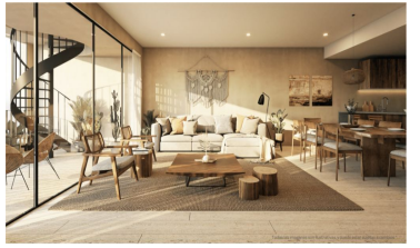
Terraza privada en planta alta en algunas unidades Roof top private terrace in some units