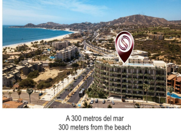
A 300 metros del mar 300 meters from the beach