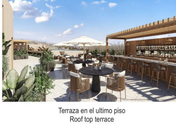
Terraza en el último piso Roof top terrace