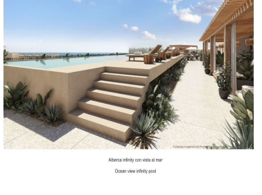
Alberca infinity con vista al mar Ocean view infinity pool