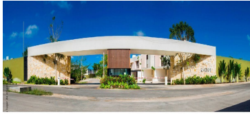
Entrada principal Acceso controlado Barda perimetral