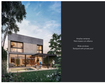
Amplias ventanas Patio interior con alberca Wide windows Backyard with private pool