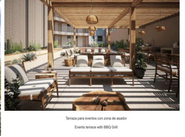
Terraza para eventos con zona de acobar Events terrace with BBQ Grill